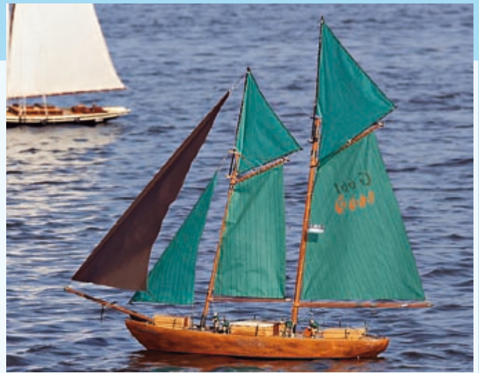
Schön gebaut, jedoch dank künstlicher Alterung und fehlendem echtem Vorbild in der Bauwertung weit hinten: die Orinoco Flow von Torsten Hill

te ich mich jedoch wahrlich nicht beklagen. Offensichtlich rechneten die Schiedsrichter es mir hoch an, dass ich ohne Bauplan komplett nach Ansichten des derzeit am Bodensee liegenden Vorbilds baue. Weniger Glück hatte leider unser Team-Mitglied Torsten Hill. Seine eigentlich schön gebaute Orinoco Flow erhielt mit 65 von 100 Punkten mit Abstand die schlechteste Bauwertung, da sie zum einen künstlich gealtert wurde und somit nicht den Forderungen nach „wertfrischem“ Aussehen entsprach und als Typschiff kein bestimmtes Vorbild hat. Angesichts der Regelung, dass auch Baukastenboote ohne Vorbild nicht stark abgewertet werden, etwas schade!