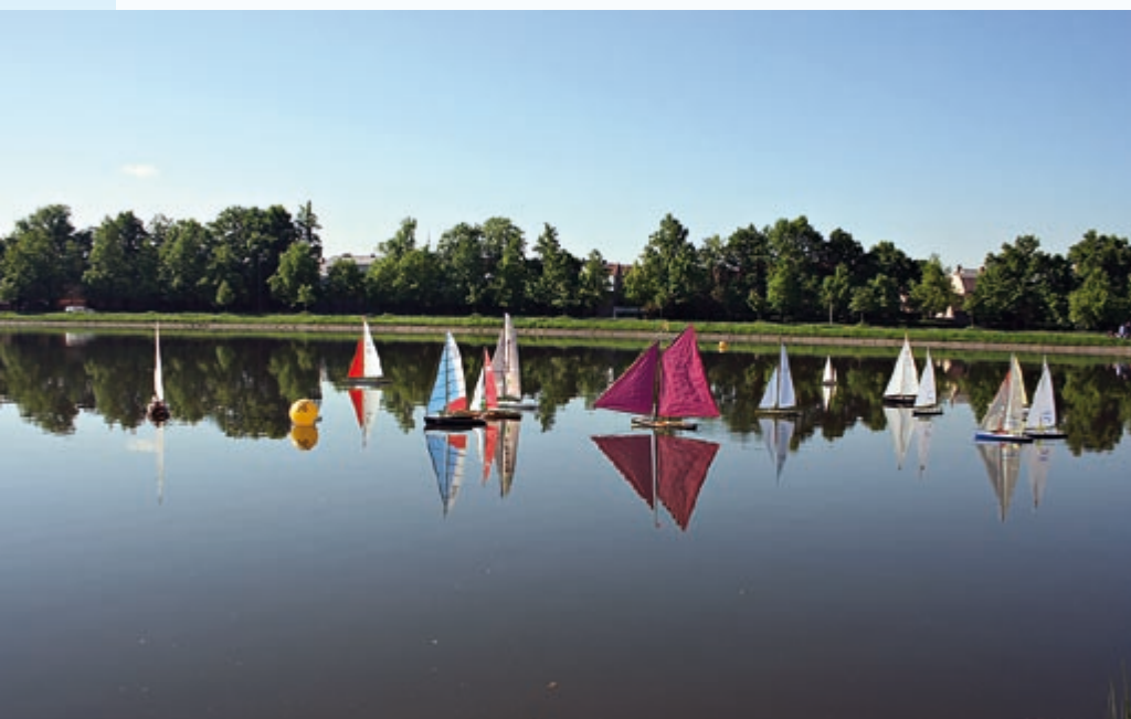
Nahezu kein Wind weht beim Start des ersten Laufs am Freitag