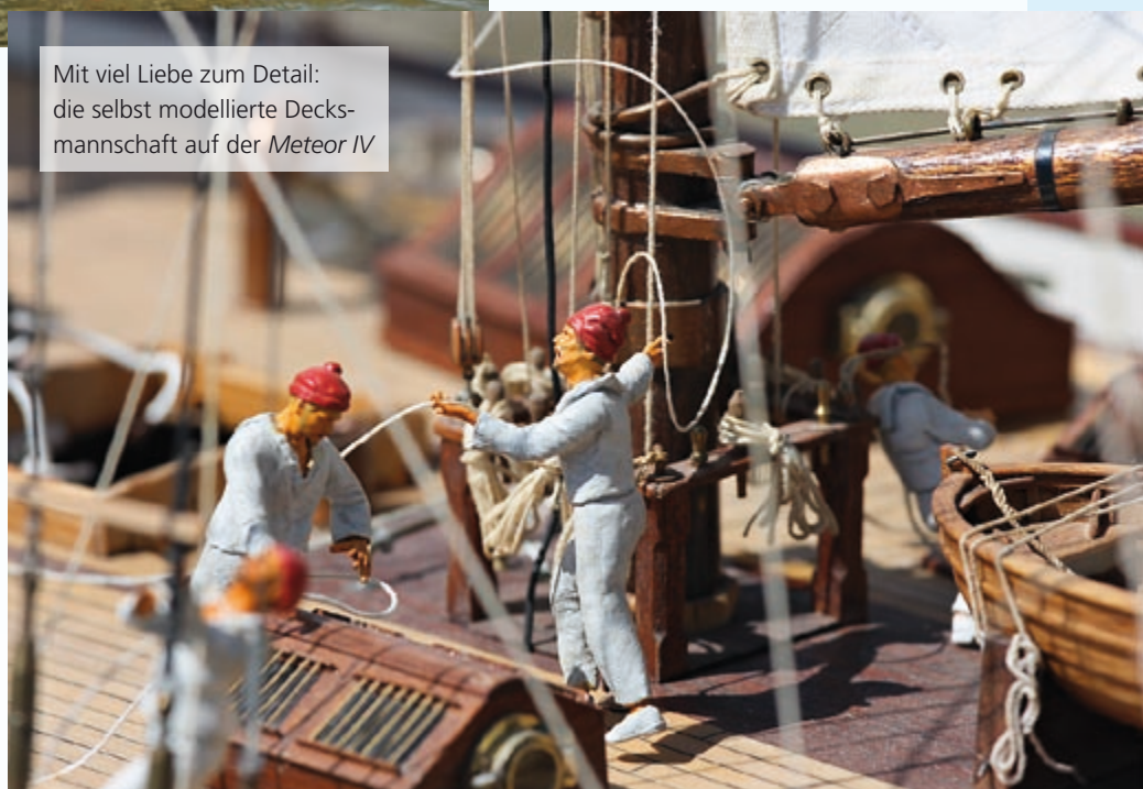
Mit viel Liebe zum Detail: die selbst modellierte Decks-mannschaft auf der Meteor IV

tion, sondern die Bauausführung in Bezug auf die vorgesehene Konstruktion des Herstellers gemäß Bauplan. Dies mag zwar hinsichtlich der Mühen zur Konstruktion eines komplett selbst gebauten Modells nach Unterlagen zum Vorbild seltsam anmuten, erleichtert jedoch dem Interessierten den Einstieg in die Klasse. Sehr positiv überrascht war ich von der Bauwertung meines Boots, die wieder einmal zeigte, dass die Schiedsrichter insgesamt sehr wohlwollend bewerten. Hatte ich Bedenken, mit meinem noch nicht fertig gestellten Boot Safari stark abgewertet zu werden, wurde ich eines Besseren belehrt. Mit 78 Punkten zwar eines der Schlusslichter in der Bauwertung, angesichts noch unlackierter Walkingstöcke als Masten sowie aus rohem Balsa bestehender Plicht konn-