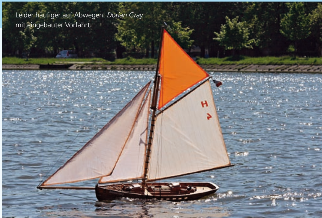
Leider häufiger auf Abwegen: Dorian Gray mit eingebauter Vorfahrt