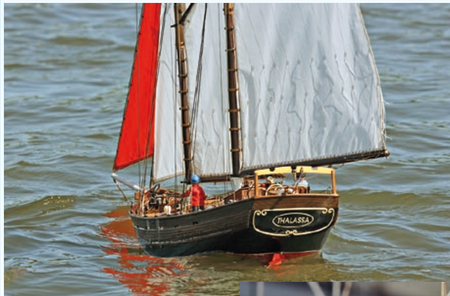
Die Thalassa – nicht zuletzt dank der exzellenten Bauwertung Sieger in der Gaffelklasse