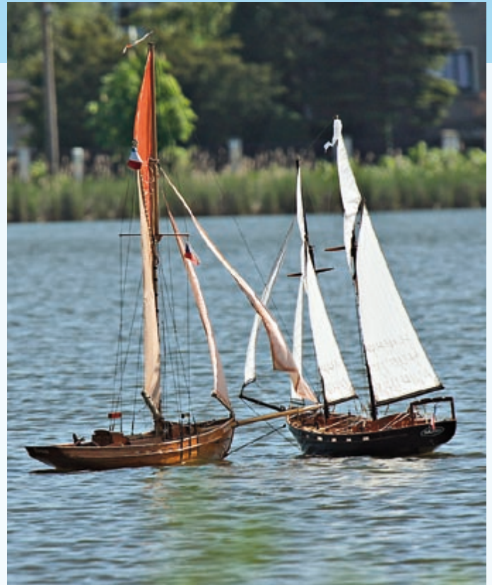
Fast eine Kollision auf dem Teich

lina mit ihren 2 m 2 Segelfläche herrschten beste Bedingungen, und sie setzte sich sofort an die Spitze. Den bewegungslosen Pulk hinter sich lassend, bewegte sie sich langsam, aber stetig um den Kurs. Ulli war dadurch als Erster nach einer halben Stunde mit der ersten Runde fertig, und hätte so innerhalb der 45 Minuten noch nicht einmal eine zweite Runde geschafft. Das Referenzboot zur Bestimmung der Rundenzahl (üblicherweise das an der fünften Position) war nach 42 Minuten durch, sodass der Lauf nach der ersten Runde beendet war.