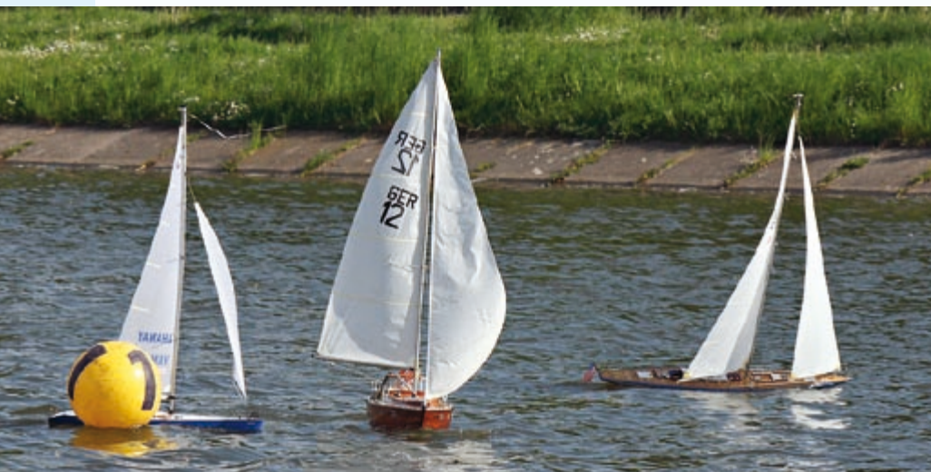
Knappes Bojenduell zwischen Yamaha und Spirit of Freedom

Verlag für Technik und Handwerk GmbH, Bestellservice, 76526 Baden-Baden