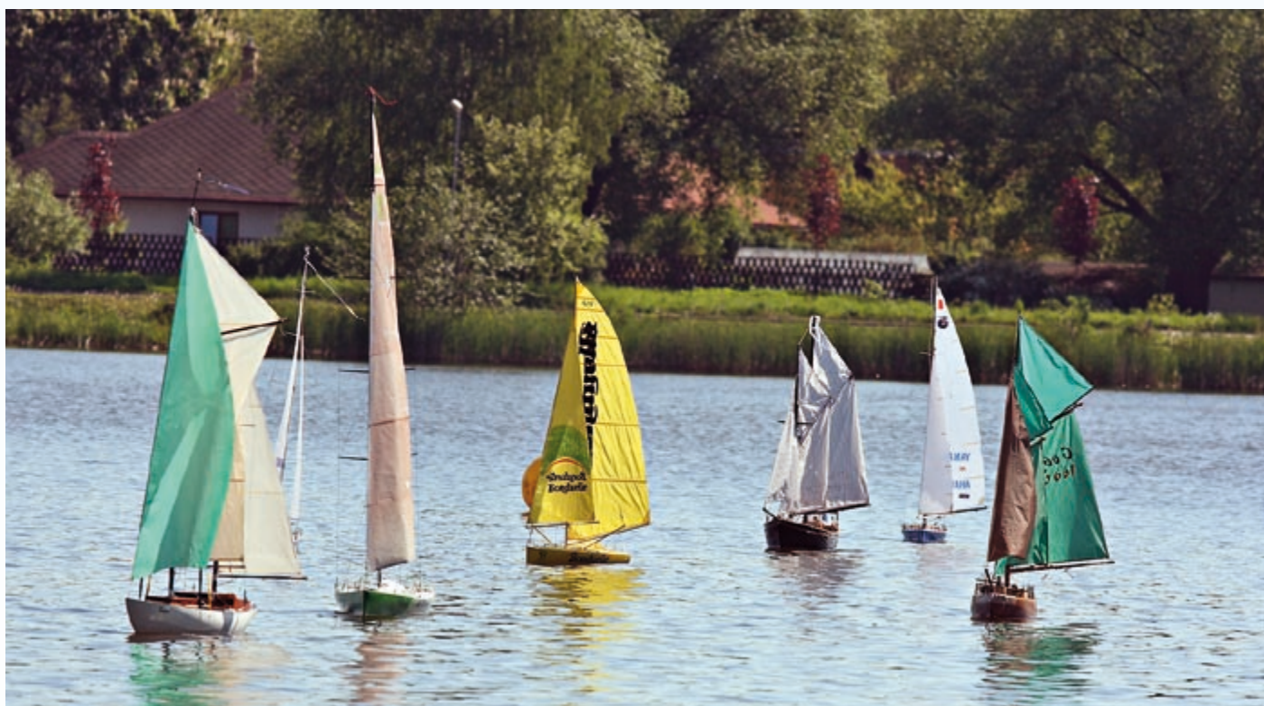
Hochgetakelte und Gaffelsegler gemeinsam bei der Wanderregatta