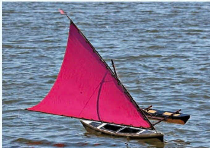
Ulli Schramms neueste Konstruktion und ein interessanter Zeitvertreib in den Wettkampfpausen: die polynesische Proa