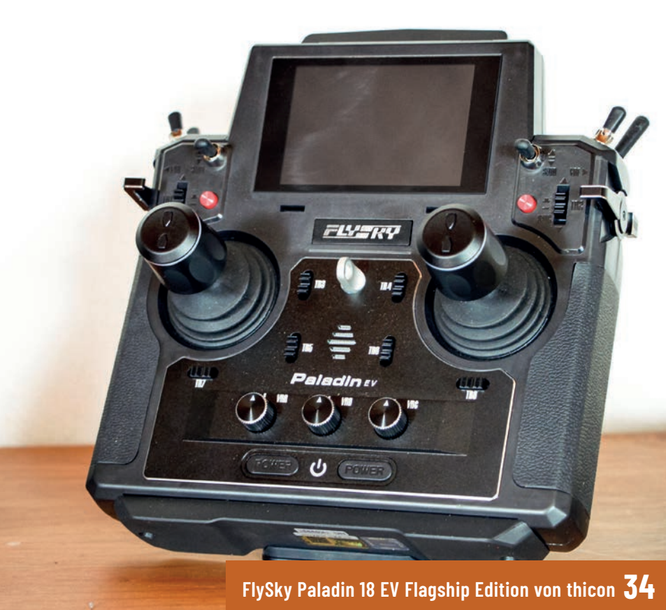
FlySky Paladin 18 EV Flagship Edition von thicon 34