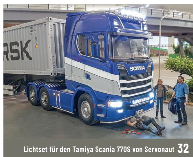
Lichtset für den Tamiya Scania 770S von Servonaut 32