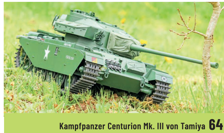
Kampfpanzer Centurion Mk. III von Tamiya 64