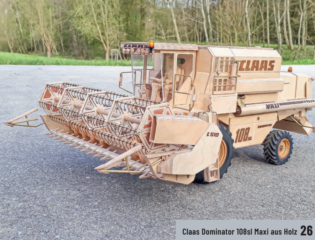
Claas Dominator 108sl Maxi aus Holz 26