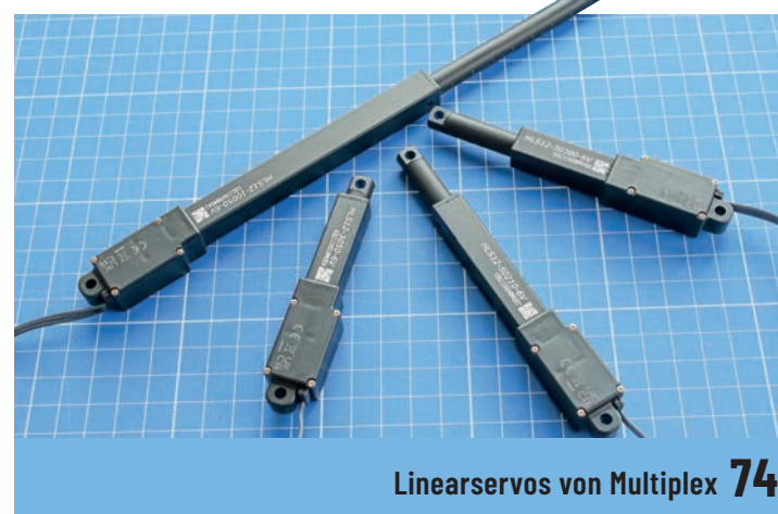
Linearservos von Multiplex 74