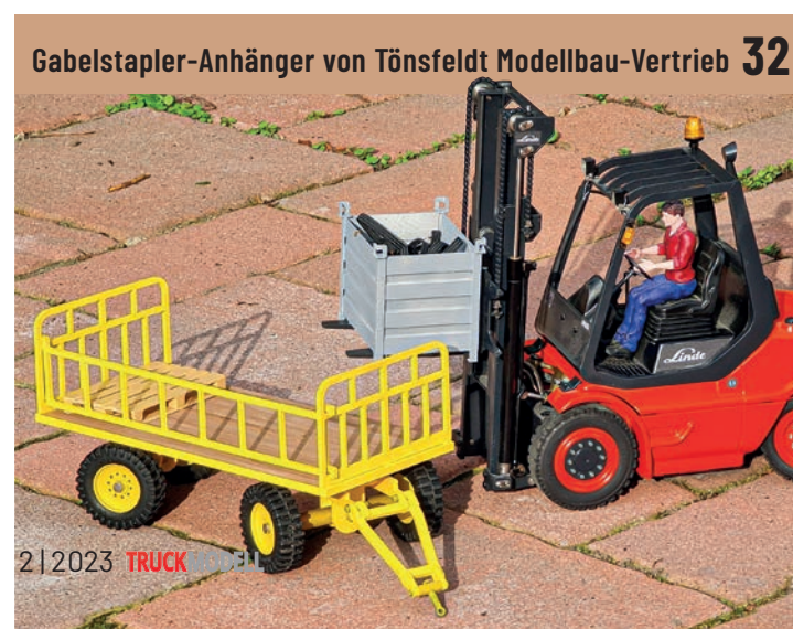
Gabelstapler-Anhänger von Tönsfeldt Modellbau-Vertrieb 32