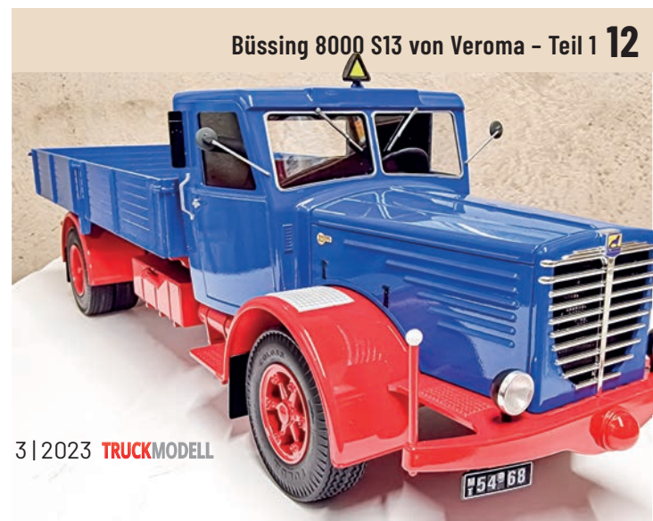
Büssing 8000 S13 von Veroma – Teil 1 12