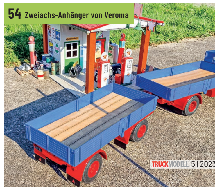
54 Zweiachs-Anhänger von Veroma