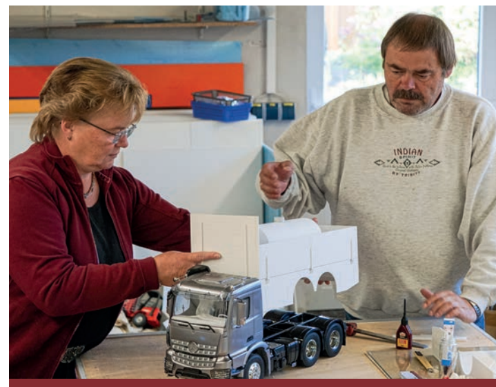
15 Jahre Der RC-Bruder 54