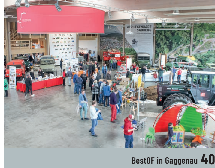
BestOF in Gaggenau 40