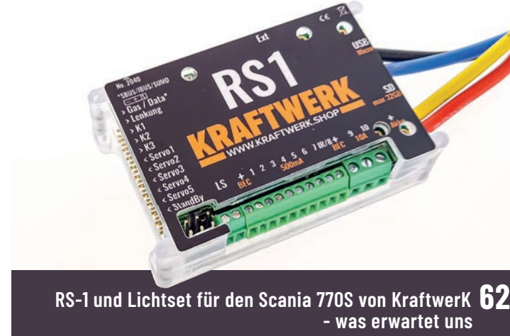
RS-1 und Lichtset für den Scania 770S von Kraftwerk 62 – was erwartet uns