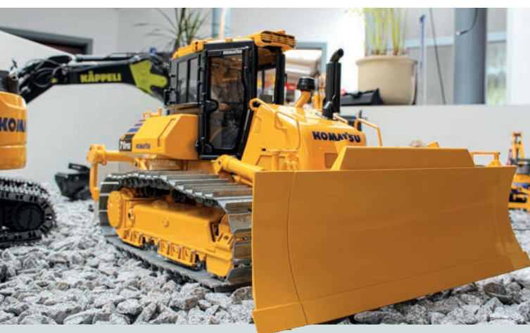
Preview: Komatsu D71 PX-24 von Fumotec 26