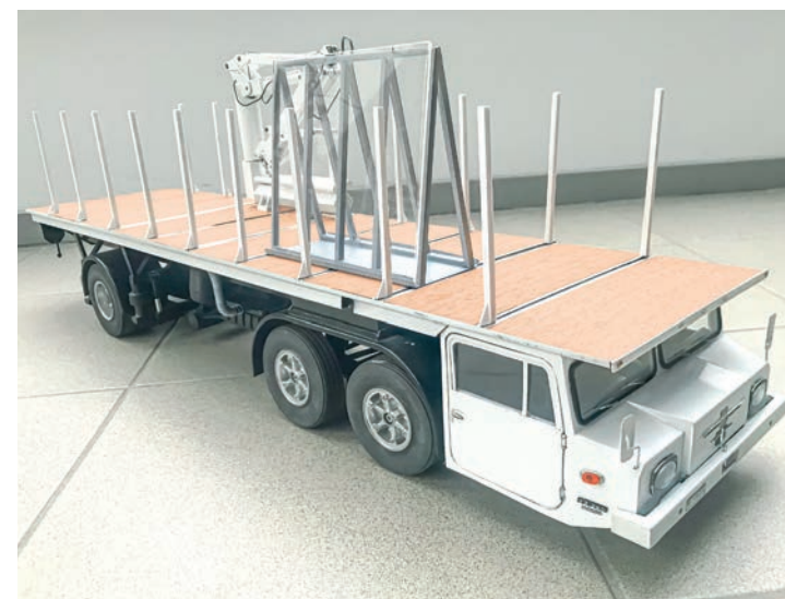
Büssing Decklaster als RC-Modell im Maßstab 1:15 78