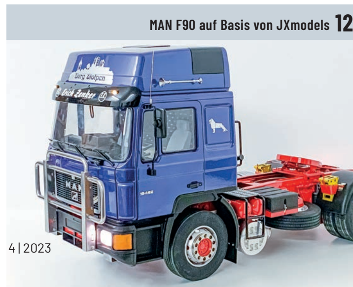
MAN F90 auf Basis von JXmodels 12