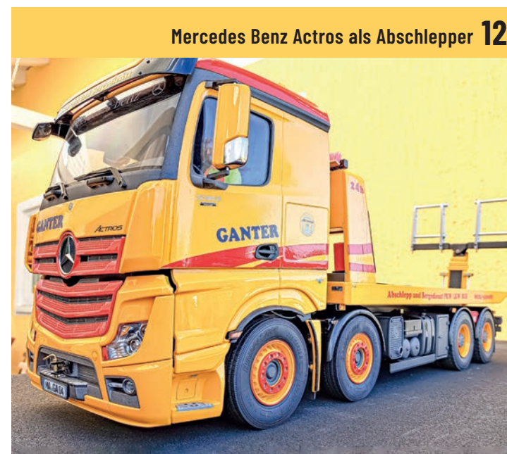
Mercedes Benz Actros als Abschlepper 12