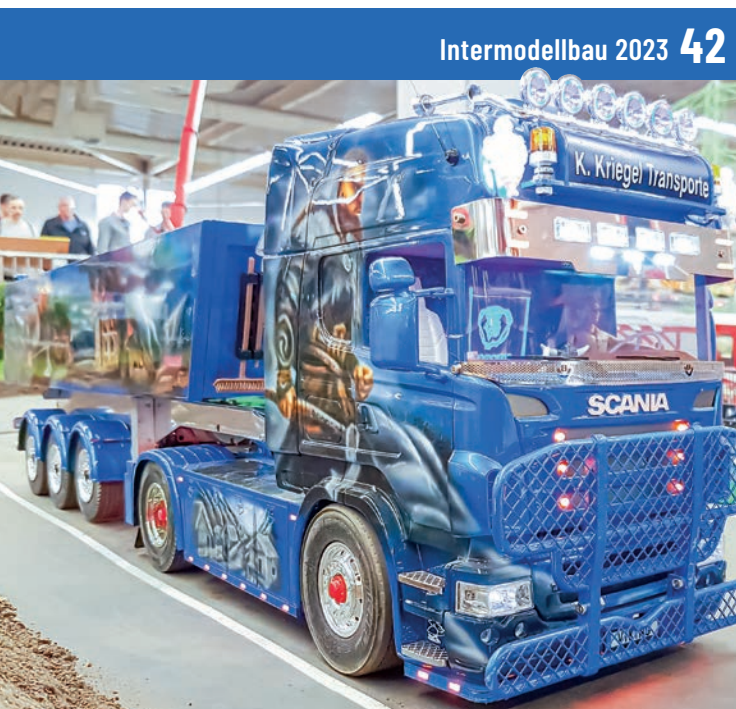
Intermodellbau 2023 42