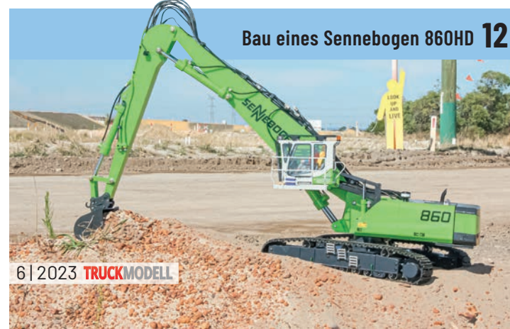
Bau eines Sennebogen 860HD 12