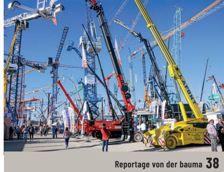
Reportage von der bauma 38