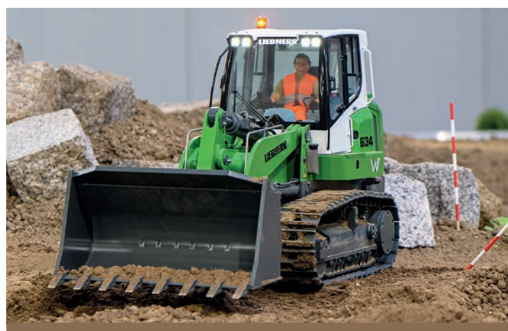
12 Laderaupе Liebherr LR634