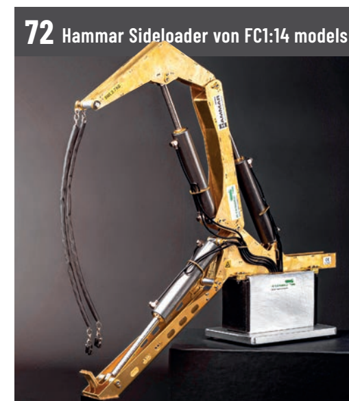
72 Hammar Sideload von FC1:14 models