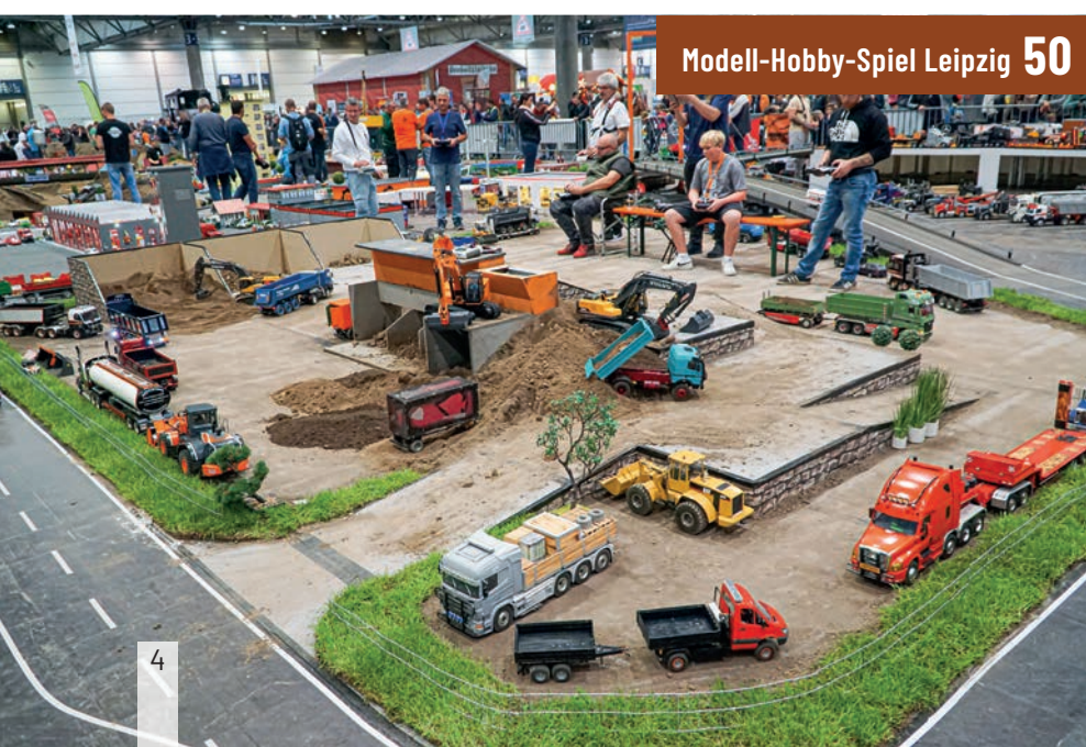
Modell-Hobby-Spiel Leipzig 50