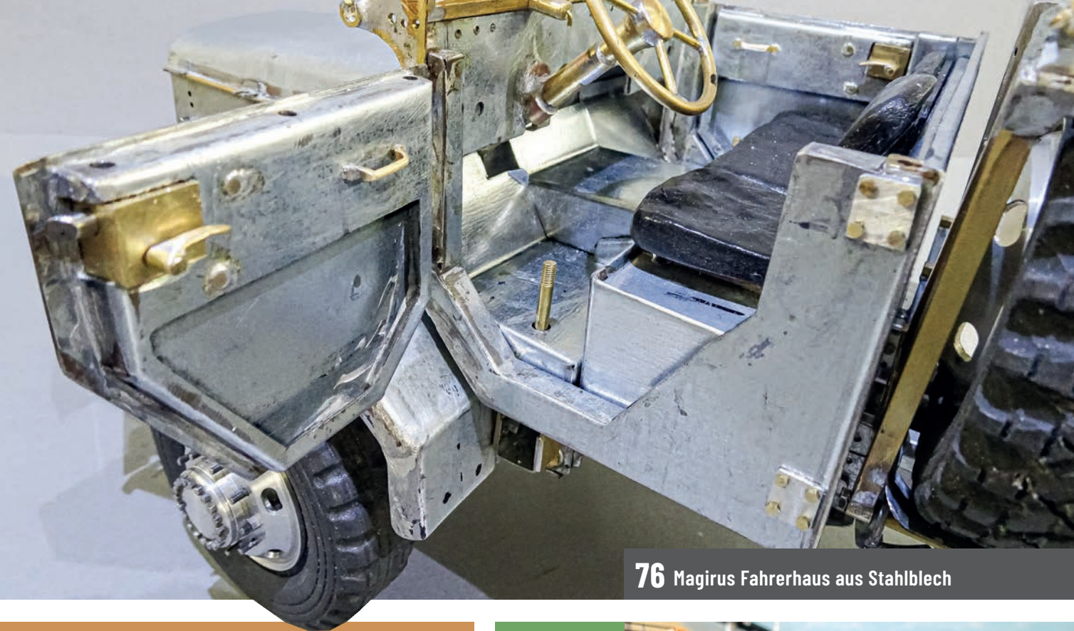
76 Magirus Fahrerhaus aus Stahlblech