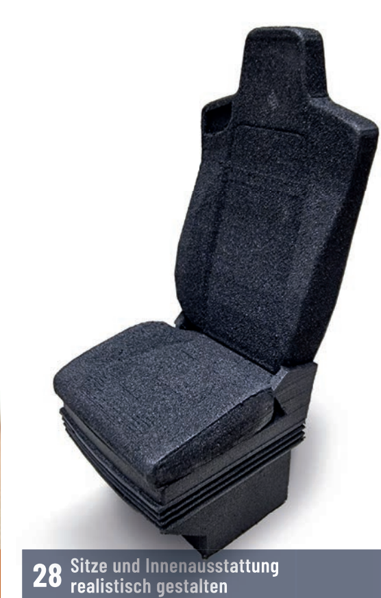
28 Sitze und Innenausstattung realistisch gestalten