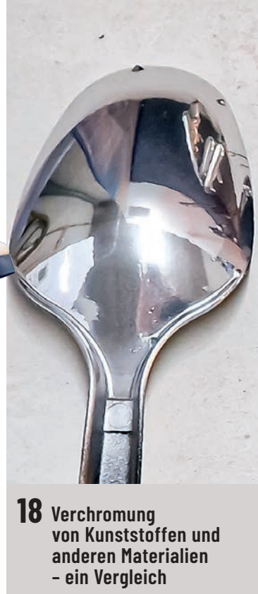
18 Verchromung von Kunststoffen und anderen Materialien – ein Vergleich