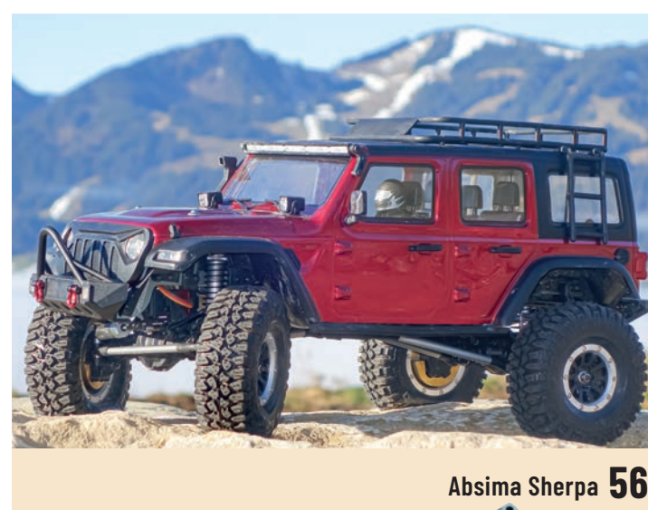
Absima Sherpa 56