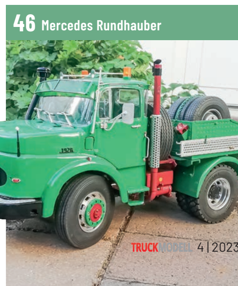
46 Mercedes Rundhauber