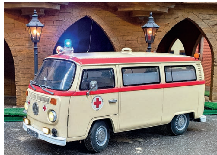
VW-Bus T2 B des österreichischen Roten Kreuz 22