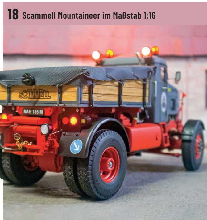
18 Scammell Mountaineer im Maßstab 1:16