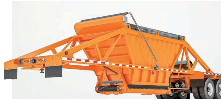
Belly Dumper Trailer in 1:8 – VTH-Bauplan 3205110 48