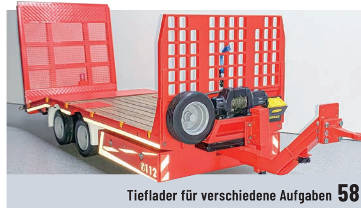
Tiefelader für verschiedene Aufgaben 58