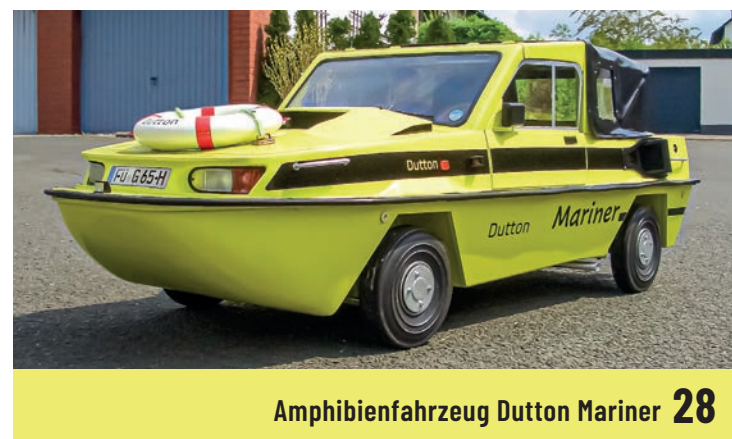
Amphibienfahrzeug Dutton Mariner 28