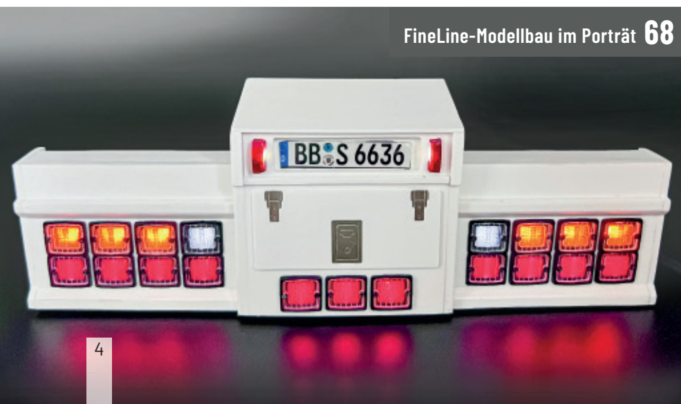
FineLine-Modellbau im Porträt 68