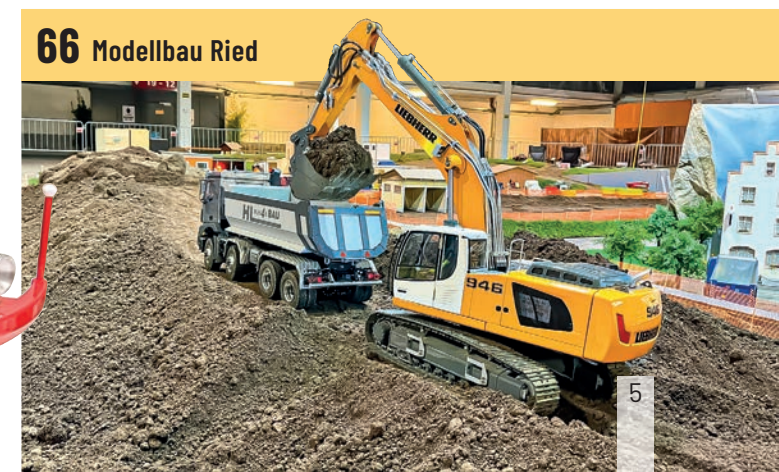
66 Modellbau Ried