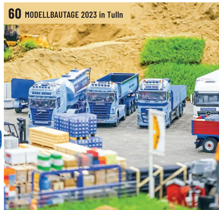
60 MODELLBAUTAGE 2023 in Tulln