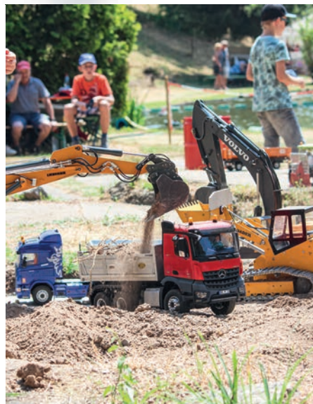
59 Sommerfest beim SMC Murgtal Gernsbach