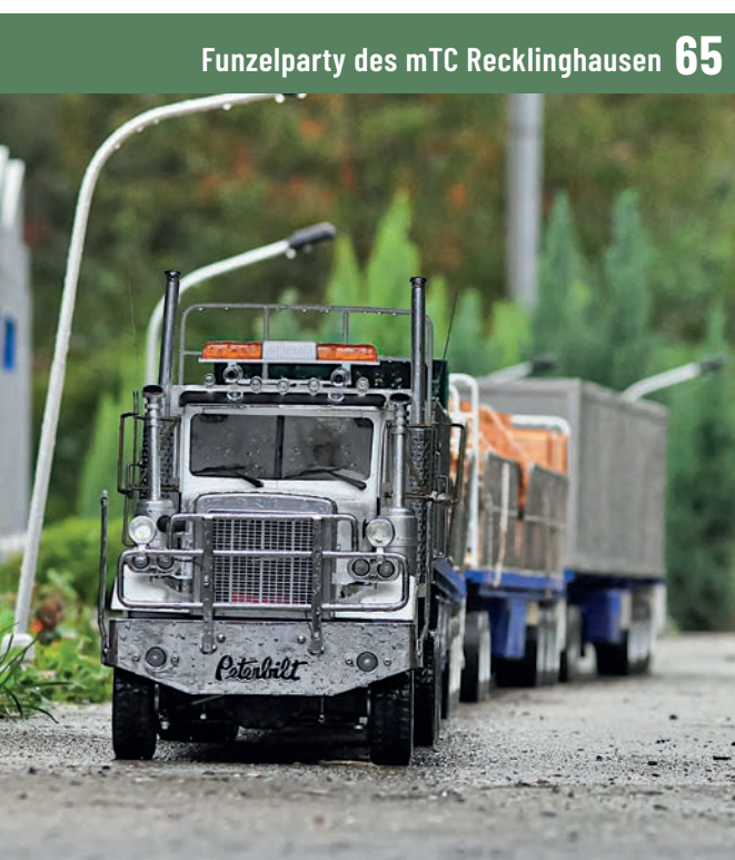
Funzelparty des mTC Recklinghausen 65