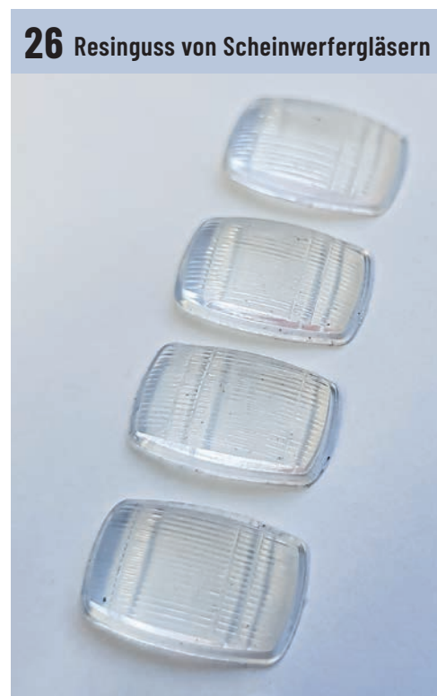
26 Resinguss von Scheinwerfergläsern