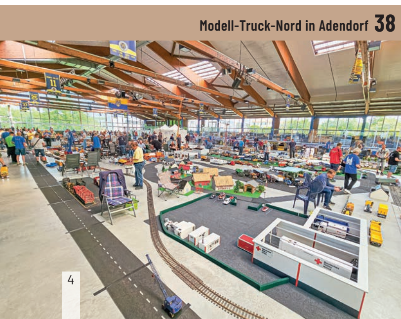
Modell-Truck-Nord in Adendorf 38