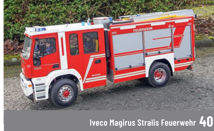
Iveco Magirus Stralis Feuerwehr 40