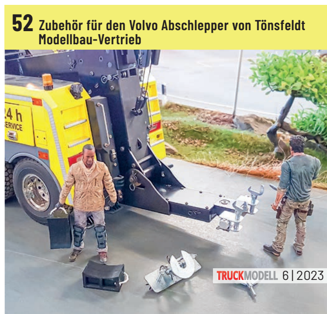
52 Zubehör für den Volvo Abschlepper von Tönsfeldt Modellbau-Vertrieb