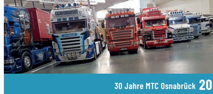
30 Jahre MTC Osnabrück 20