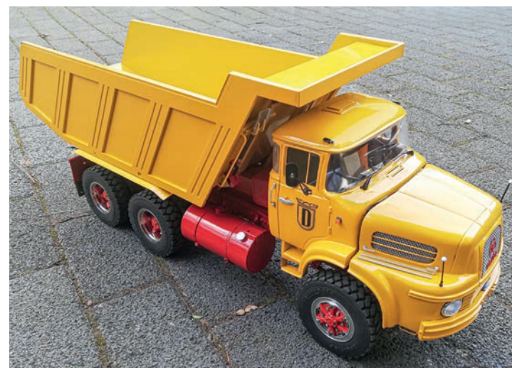
Kipper Krupp K360 26