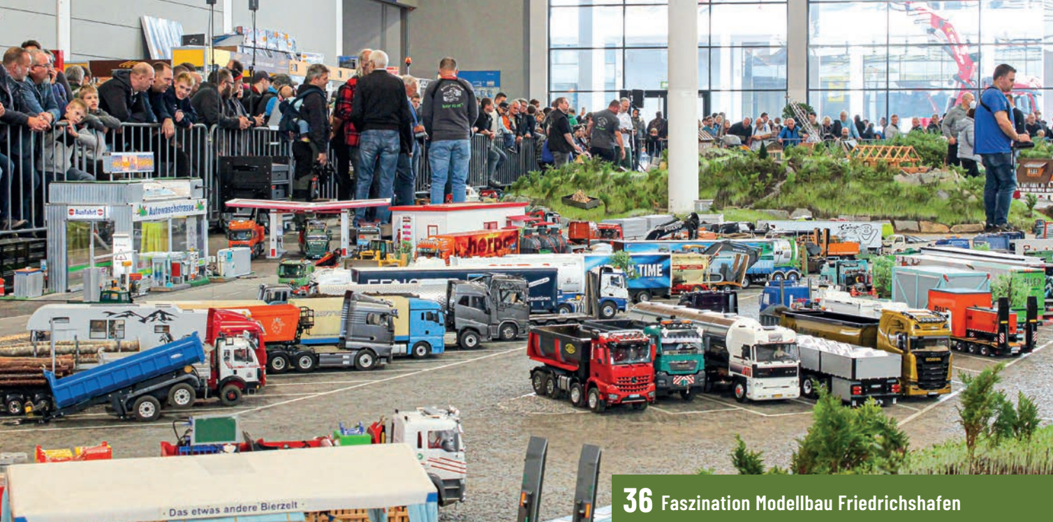
36 Faszination Modellbau Friedrichshafen