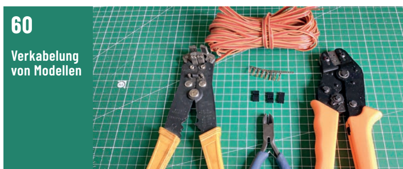
60 Verkabelung von Modellen