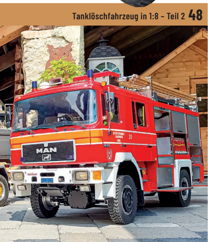
Tanklöschfahrzeug in 1:8 – Teil 2 48