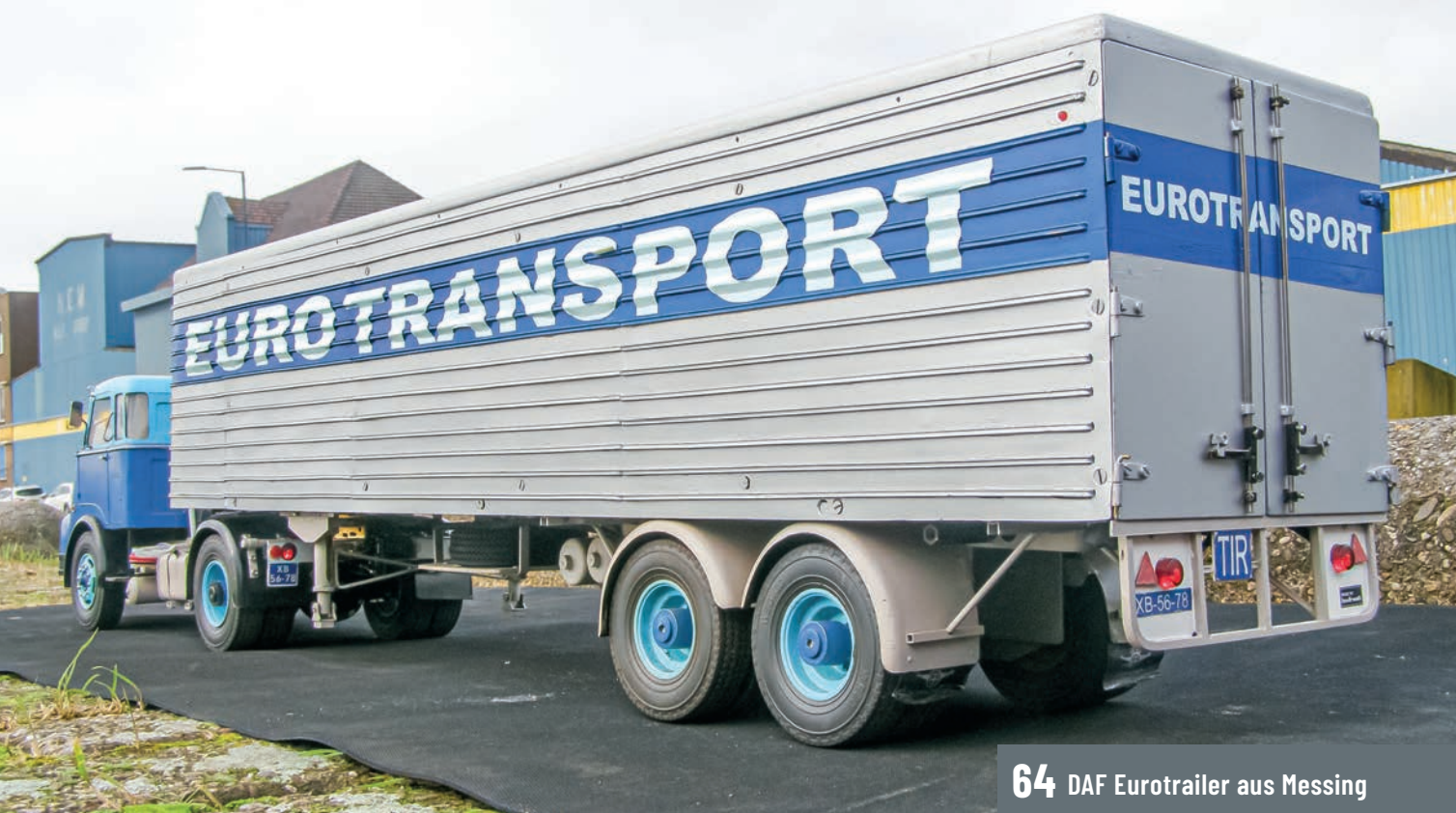
64 DAF Eurotrailer aus Messing