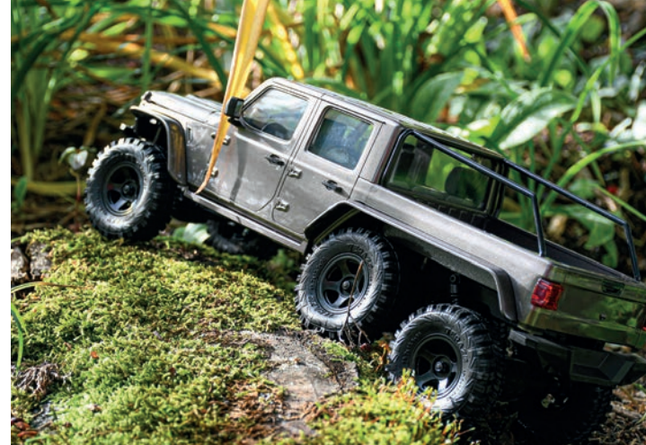
Cheyenne 6x6 von RocHobby/D-Power 74