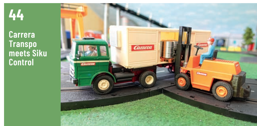
44 Carrera Transpo meets Siku Control