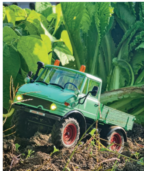
64 Mogrich von RocHobby/ D-Power Power