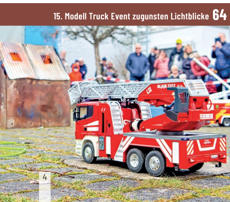
15. Modell Truck Event zugunsten Lichtblicke 64