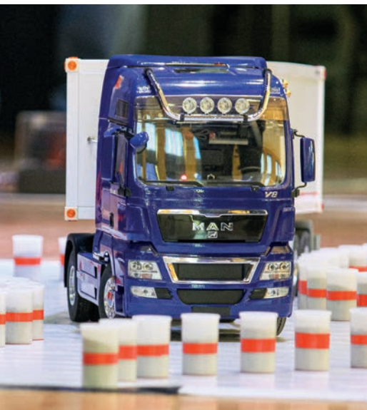
Deutsche Meisterschaft in Siegen 42