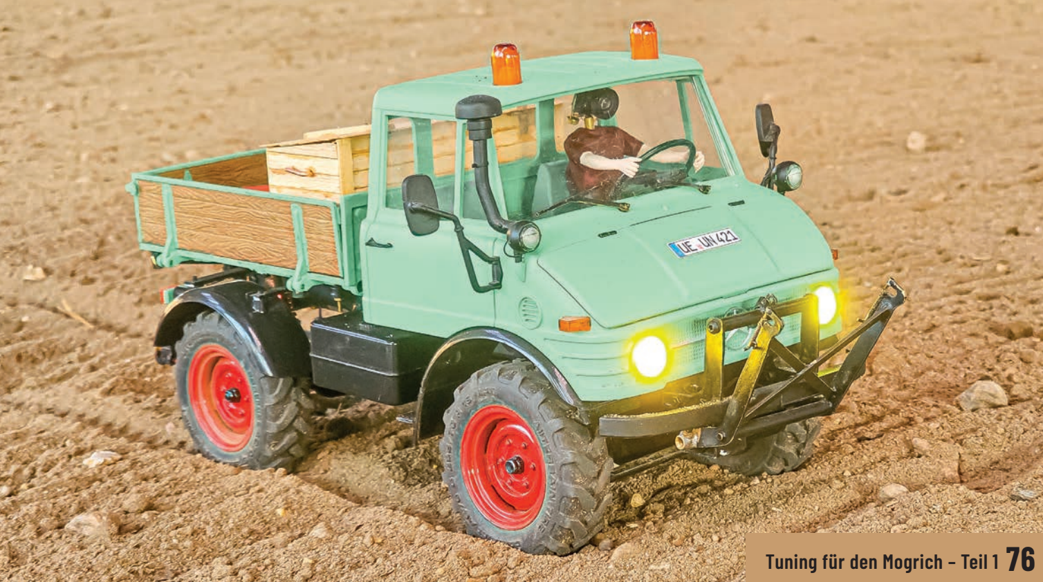
Tuning für den Mogrich – Teil 1 76