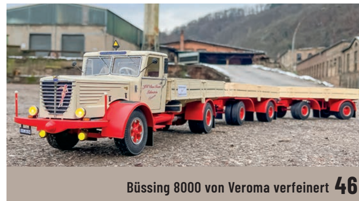
Büssing 8000 von Veroma verfeinert 46