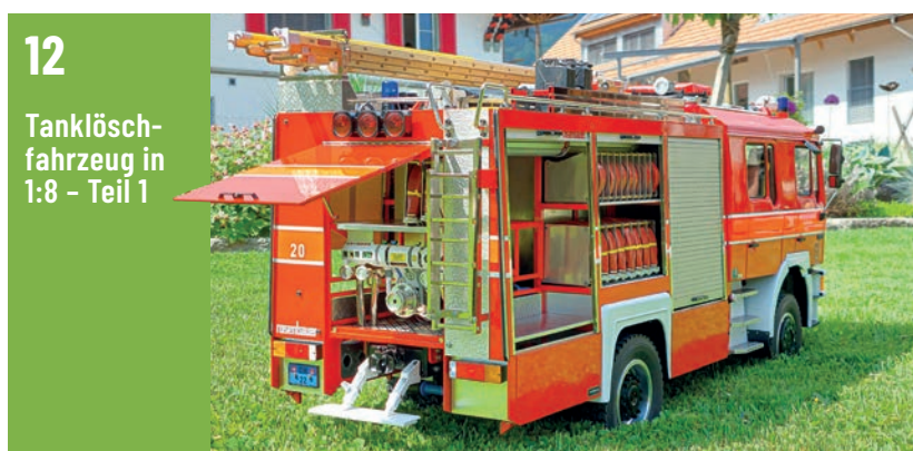
12 Tanklöschfahrzeug in 1:8 - Teil 1