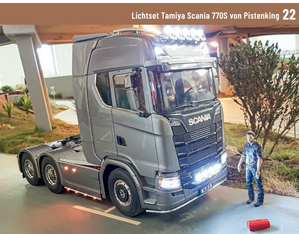
Lichtset Tamiya Scania 770S von Pistenking 22