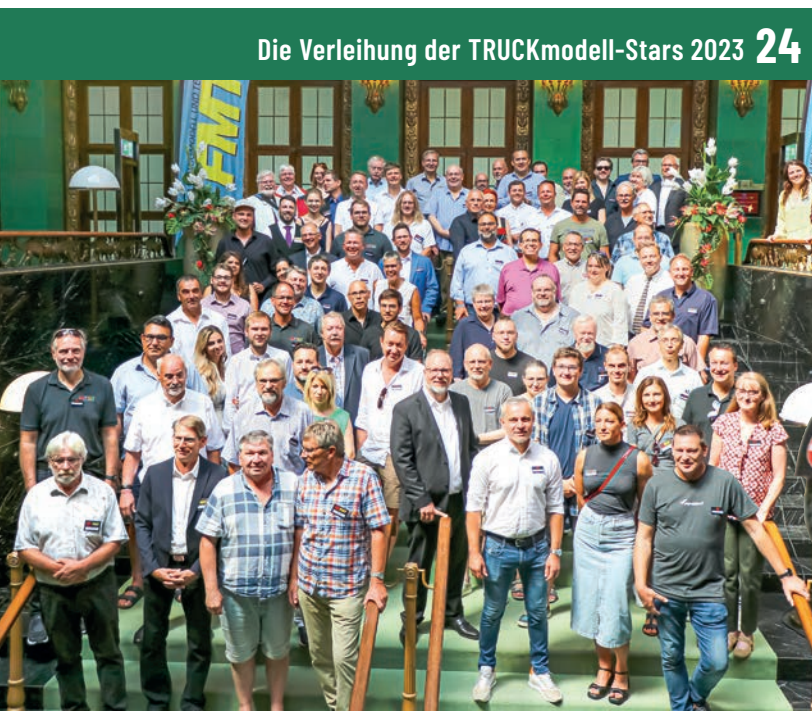
Die Verleihung der TRUCKmodell-Stars 2023 24