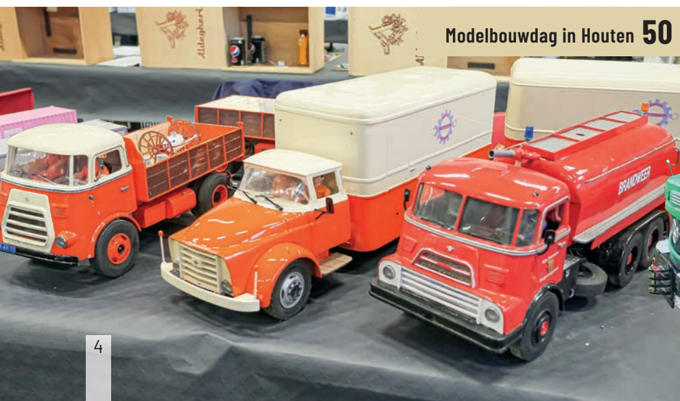
Modelbouwdag in Houten 50